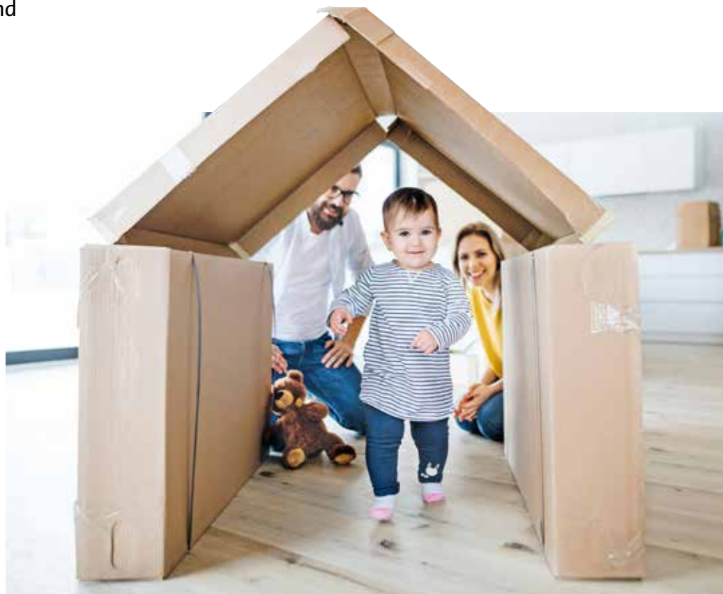
> Platz machen für jene, die ihn dringender brauchen?

Freiburg versüßt Altmietern, die aus mindestens drei Zimmern ausziehen und sich um wenigstens ein Zimmer verkleinern, den Umzugsaufwand mit einer Tauschprämie in Höhe von 2 000 Euro. Die Stadt will auf diese Weise vor allem die Wohnungs- und Raumknappheit von Familien mit kleinen Kindern abmildern. „Wir aktivieren Wohnraum“, unterstreicht Quathamer. Aus seiner Sicht ist der Aufwand von Tauschbörse und -prämie angemessen. Er rechnet vor, dass, wenn nur fünf Personen sich pro Jahr per Tausch um jeweils 30 Quadratmeter verkleinern, Baukosten für 150 Quadratmeter Wohnfläche gespart werden können. Wenn man annimmt, dass ein Quadratmeter sozialer