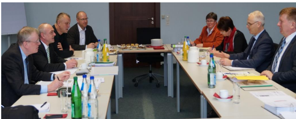
Während der Verhandlung am 9. Februar 2016 im Sächsischen Finanzministerium in Dresden