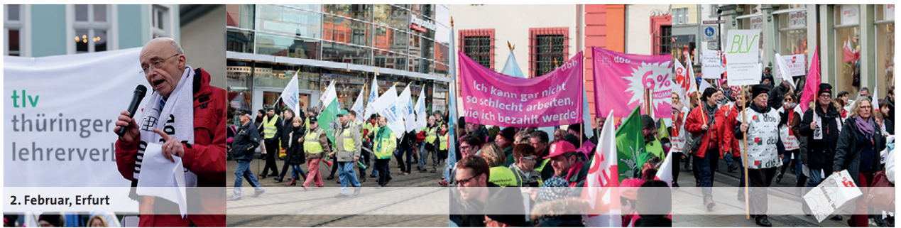
2. Februar, Erfurt

doch endlich diese alten Rituale über Bord und lasst uns konkret werden! Seit 2011 erfüllt Mecklenburg-Vorpommern die Kriterien der Schuldenbremse, keine Neuverschuldung seit fast zehn Jahren – das wurde auch mit finanziellen Opfern der Landesbeschäftigten erreicht. Jetzt ist es endlich an der Zeit, ihre Leistungen mit einem anständigen Tarifabschluss wertzuschätzen. Dazu gehört selbstverständlich auch die zeit- und inhaltsgleiche Übertragung auf die Beamten.“