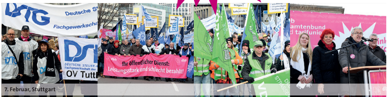
7. Februar, Stuttgart