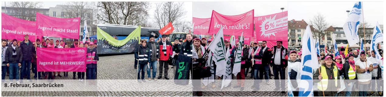
8. Februar, Saarbrücken