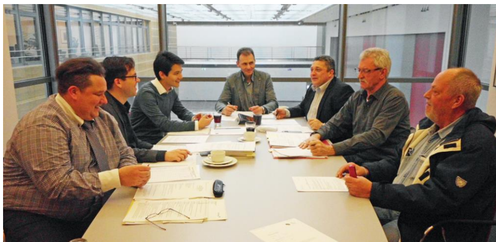
dbb Verhandlungskommission Kampfmittelräumdienst

Auch bei den Zulagen muss es Verbesserungen geben! Die Zulagenbeträge für Gefahrenzulagen, den Umgang mit besonders gefährlichen Sprengkörpern oder Tauchereinsätze sind teilweise über 20 Jahre nicht erhöht worden. Dies wird der Arbeit für das Gemeinwohl unter Einsatz des Lebens und der damit verbundenen hohen psychischen Belastung der Angehörigen im Kampfmittelräumdienst schon lange nicht mehr gerecht. Daher fordert der dbb, dass die Zulagen entsprechend erhöht werden!