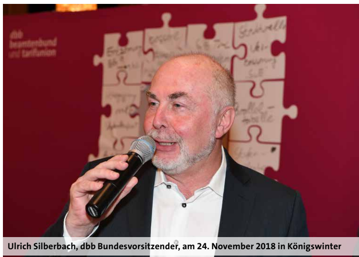
Ulrich Silberbach, dbb Bundesvorsitzender, am 24. November 2018 in Königswinter

„Die fehlende Wertschätzung für die Bildungsarbeit durch qualifizierte Pädagogen muss ein Ende haben“, forderte der dbb Bundesvorsitzende Ulrich Silberbach auf dem Branchentag am 24. November 2018 in Königswinter vor mehr als 150 VBE-Mitgliedern. Dabei gehe es aber nicht darum, die Quereinsteiger in den Lehrerberuf gegen die grundständig ausgebildeten und erfahrenen Lehrkräfte auszu-