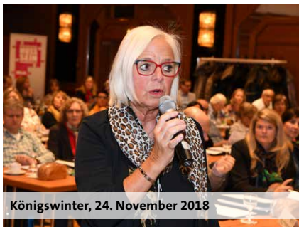
Königswinter, 24. November 2018