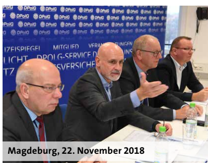
Magdeburg, 22. November 2018