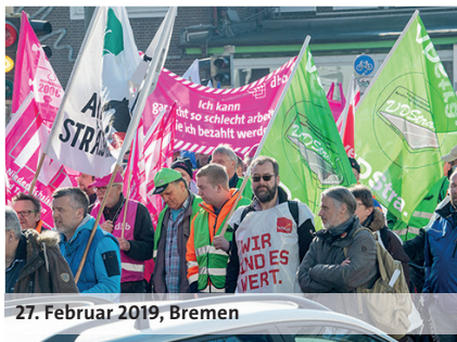
27. Februar 2019, Bremen