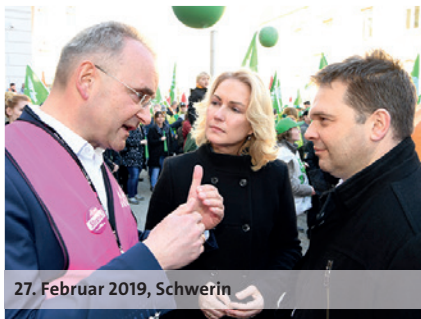
27. Februar 2019, Schwerin