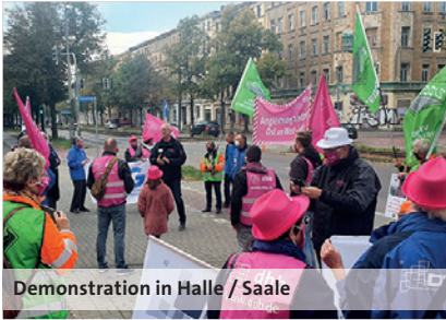
Demonstration in Halle / Saale