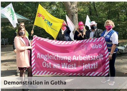
Demonstration in Gotha