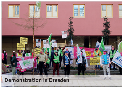
Demonstration in Dresden