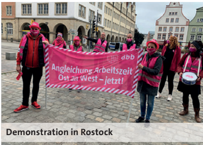
Demonstration in Rostock